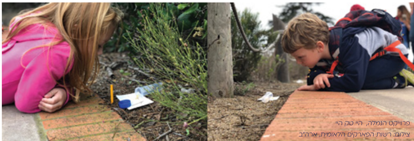
פרוייקט הנמלה, היי טק היי

פיתוח מקצועי יכול לעתים קרובות להינתן כאירועים וכקורסים קצרים אשר לעיתים מעניקים השראה אך לרוב הם אינם קשורים למציאות היום-יומית של הוראה ולמידה בבתי הספר. משמעות הדבר היא שמורים חוזרים לבתי הספר שבהם הם מלמדים, ושם הם נאבקים כדי ליישם את הרעיונות המופשטים ואת ההזדמנות לשינוי משמעותי שמוחמץ.