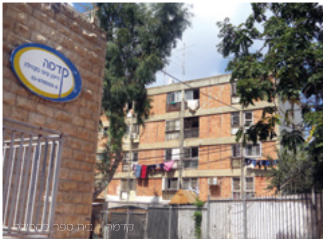
קדמה - בית ספר בקהילה

הפדגוגיה מבוססת על קשר אישי בין כל תלמיד למורה המהווה דמות משמעותית, יוצרת אמון, דורשת ואינה מוותרת. המלווה מציב מטרות, מדרב ומטפח מוטיבציה ואמונה ביכולת. הפדגוגיה נשענת על היכולת בהצבת