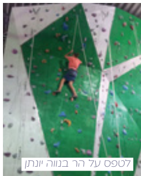
לתפס על הר בנווה יונתן