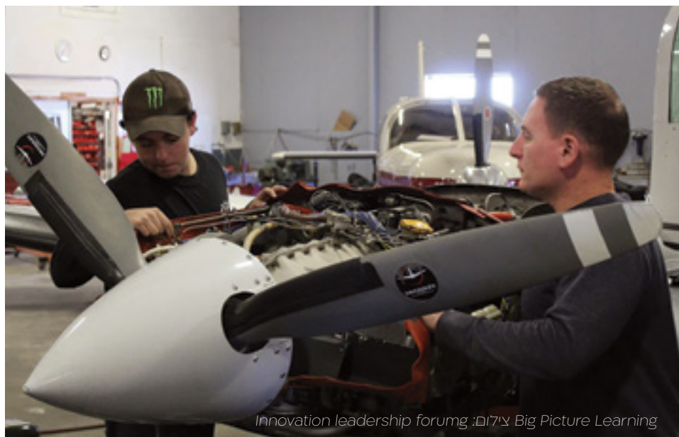
Innovation leadership forumg